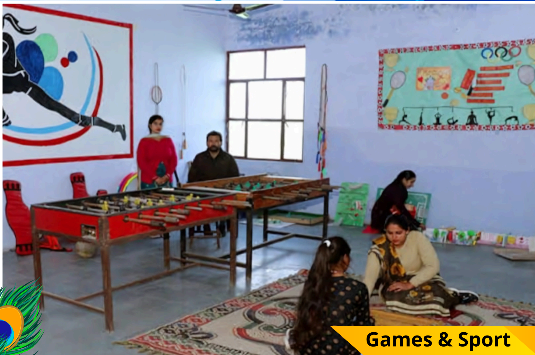
Games & Sport